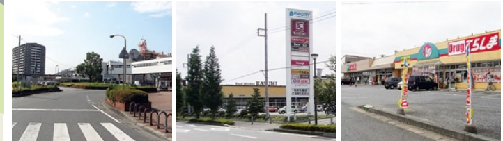
●JR荒川沖駅 ●ピアシティ荒川本郷 ●ドラッグてらしま・エコス

●JR荒川沖駅 約700m ●エコス 約150m ●常陽銀行 約300m ●荒川沖幼稚園 約800m