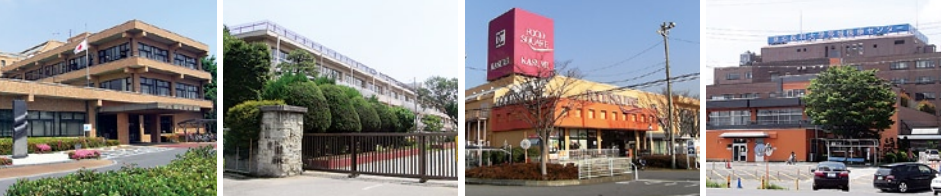
●阿見町役場 ●阿見小学校 ●フードスクエア阿見(カスミ) ●東京医科大学茨城医療センター

●阿見町役場 約700m ●ヤックスドラッグ 約150m ●筑波銀行 約300m ●阿見小学校 約800m ●阿見中学校 約600m ●東京医大 約1.4km ●フードスクエア阿見(カスミ) 約1.8km