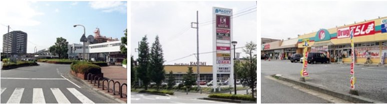
●JR荒川沖駅 ●ピアシティ荒川本郷 ●ドラッグでらしま・エコス